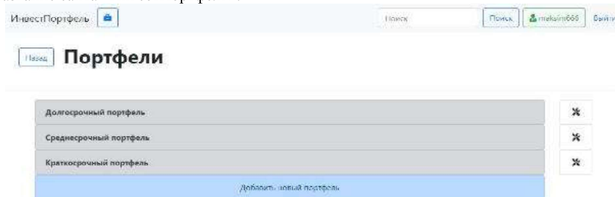
Рисунок 3 – Портфели пользователя в личном кабинете

определения их параметров, а также данная система позволяет обращаться к БД, не используя SQL-запросы напрямую. Доступ к личным портфелям для пользователя будет доступен после регистрации, если пользователь не зарегистрирован, или авторизации, если пользователь зарегистрирован. После авторизации пользователя иконка человека в красном квадрате изменяется на зелёный прямоугольник с именем пользователя. На рисунке ниже (см. Рисунок 3) изображен личный кабинет пользователя с тремя портфелями, которые можно редактировать, обновлять, создавать, удалять и другое. Также можно увидеть имя пользователя, в данном случае это «maksim666». При желании выйти из личного кабинета необходимо нажать на кнопку «Выйти». При желании пользователя вернуться на главную страницу, не выходя из личного кабинета, необходимо нажать на кнопку «Назад» или на название сайта «ИнвестПортфель».