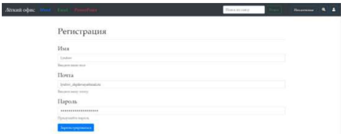
Рис. 6. Страница регистрации пользователя