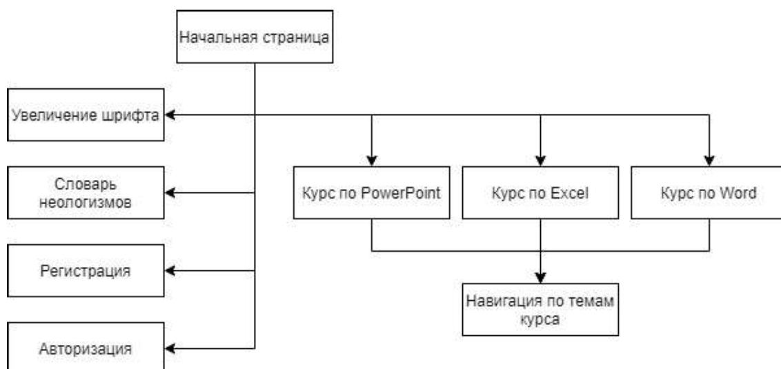
Рис. 5. Структура сценария диалога

В качестве программных средств для разработки интернет-сайта «ЛЁГКИЙ ОФИС» были использованы следующие программные средства: