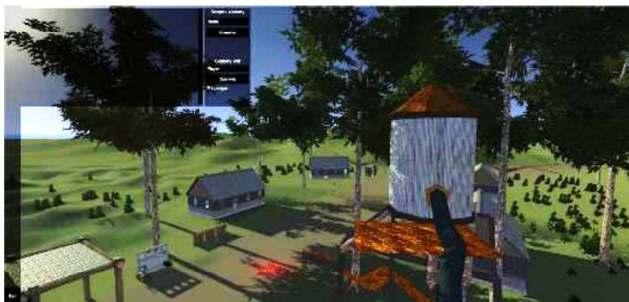
Рисунок 1 – Главное меню.