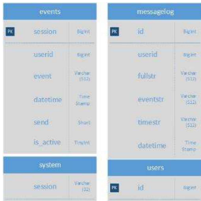
Рисунок 3. Диаграмма базы данных