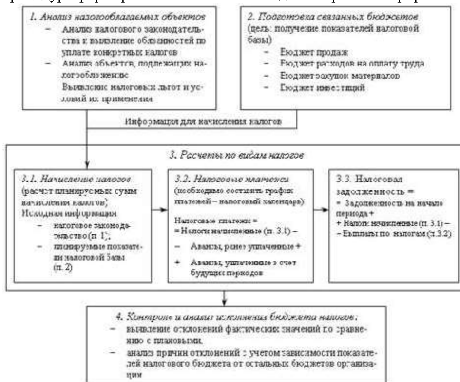
Рис. 2. Этапы процедуры формирования налогового бюджета

Процедура формирования налогового бюджета проиллюстрирована на рис. 2.