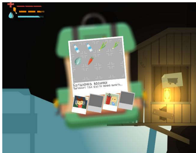
Рис. 1 Инвентарь

noticeObj.GetComponent<SpriteRenderer>().sprite = noticeSpr; if (doorScript.isLock == false) animatorNoticeType.GetComponent<SpriteRenderer>().sprite = doorSpr; } }