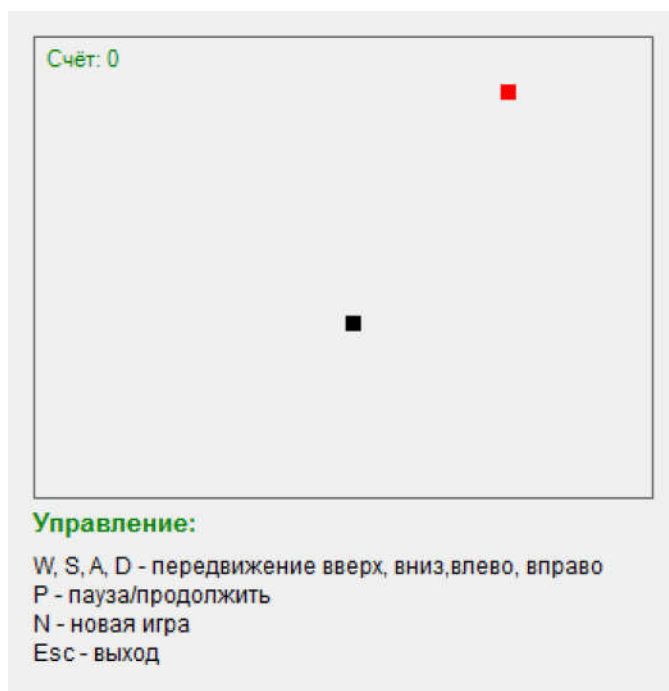
Рис. 2. Начало игры

Управление змейкой производится клавишами W , A , S , D . У пользователя есть возможность поставить игру на паузу или продолжить игру, нажав клавишу P . Для того, чтобы начать новую игру, нужно нажать клавишу N . При этом текущая игра закончится и счёт обнулится.