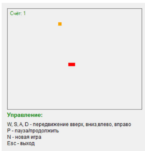
Рис. 3. Процесс игры

При поедании пищи определённого цвета змейка приобретает этот цвет, а её длина увеличивается на один элемент. К счёту также прибавляется 1 балл (рис. 3).