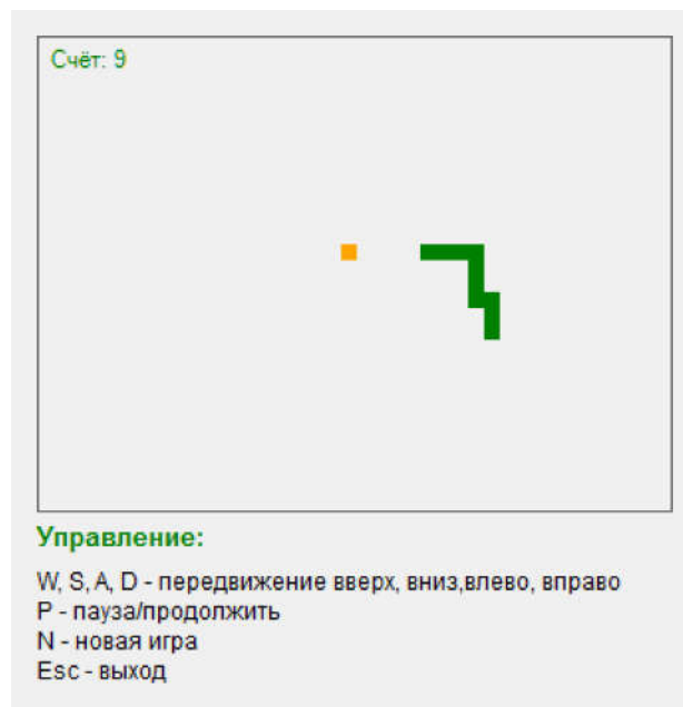
Рис. 1. Интерфейс программы

Игра начинается сразу после запуска программы. В начале игры в случайном месте на игровом поле генерируется «еда» одного из четырёх цветов: зелёного, красного, оранжевого или фиолетового. Сама змейка имеет чёрный цвет и состоит из одного элемента. Счёт на начало игры равен нулю (рис. 2).