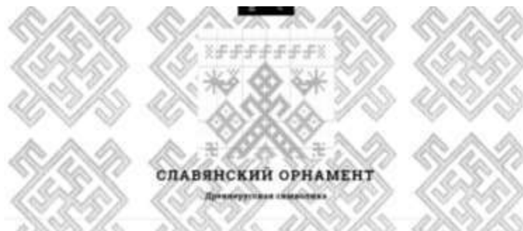
Рисунок 2. Вид сайта «Славянский орнамент».

Все символы, представленные на сайте, были описаны, раскрыт их сакральный смысл. Сайт выложен в глобальной сети Интернет. Планируется его дальнейшая разработка и продвижение в поиске.