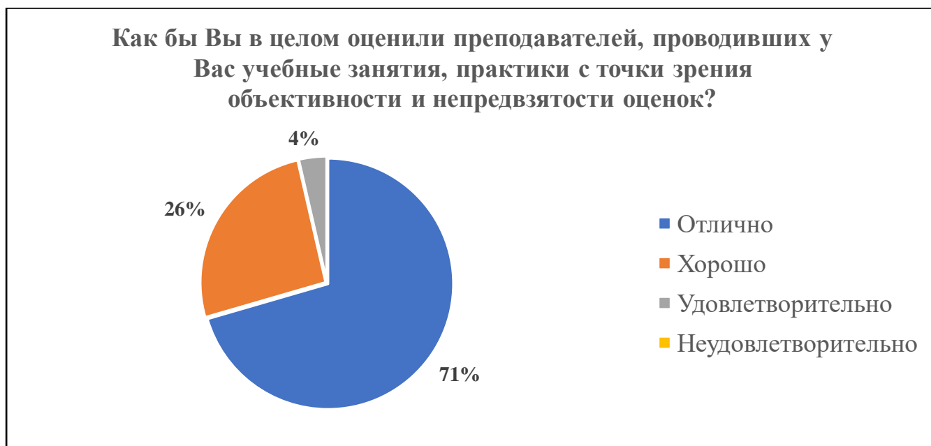
Диаграмма 11. Оценка объективности и непредвзятости преподавателей

На диаграммах 12 и 13 представлены результаты оценивания обучающимися уровня теоретической и практической подготовки. Большинство респондентов высоко оценивают подготовку, по своему направлению, специальности (75,5% – для теоретической подготовки, 69,8% – для практической). Менее 1% студентов указывают на низкий уровень практической и теоретической подготовки.