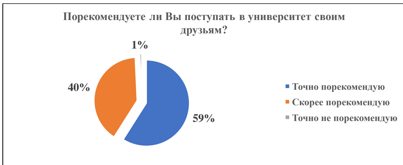
Диаграмма 1. Удовлетворенность студентов и аспирантов обучением в университете «Дубна»

Согласно полученным данным, большинство опрошенных (99%) скорее порекомендуют своим знакомым получить образование в государственном университете «Дубна» (диаграмма 1).