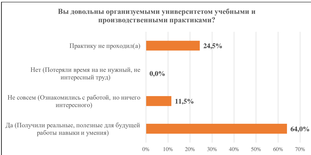
Диаграмма 9. Удовлетворенность учебными и производственными практиками

На диаграмме 9 отражена оценка обучающимися учебных и производственных практик, организуемыми филиалом «Протвино». Около 25% опрошенных студентов еще не проходили практику, 64% обучающихся получили реальные, полезные для будущей работы навыки и умения, 11,5% респондентов сообщают, что не совсем довольны практиками.