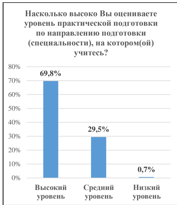
Диаграммы 12 и 13. Результаты оценки уровня теоретической и практической подготовки

В целом обучающиеся положительно оценивают качество образования по образовательным программам университета, только 2,9% опрошенных выбрали ответ «удовлетворительно». Около 63% респондентов оценивают свою образовательную программу на «отлично», 34% – на «хорошо» (диаграмма 14).