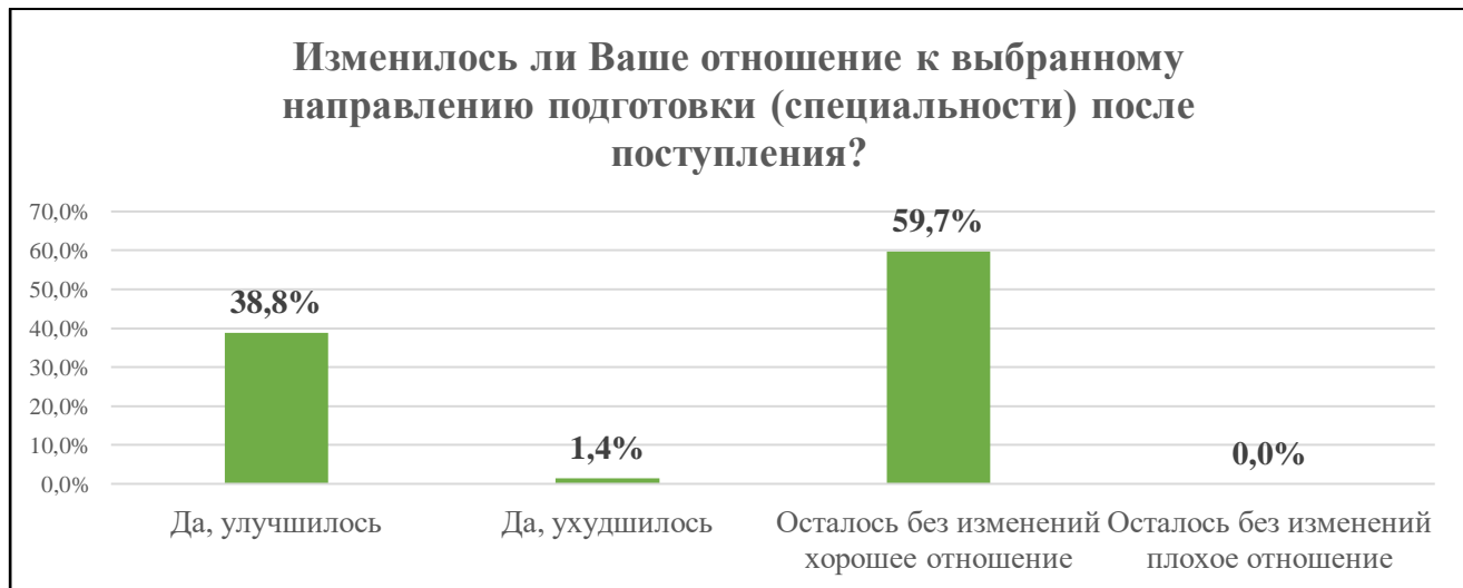
Диаграмма 3. Динамика отношения респондента к выбранному направлению подготовки (специальности)

На диаграмме 3 отражена информация об изменении отношения обучающихся к выбранному направлению подготовки (специальности). Более 98% респондентов хорошо относятся к своему направлению подготовки или стали относиться к нему лучше после поступления. Всего двое (1,4%) опрошенных студентов сообщили об ухудшении отношения.