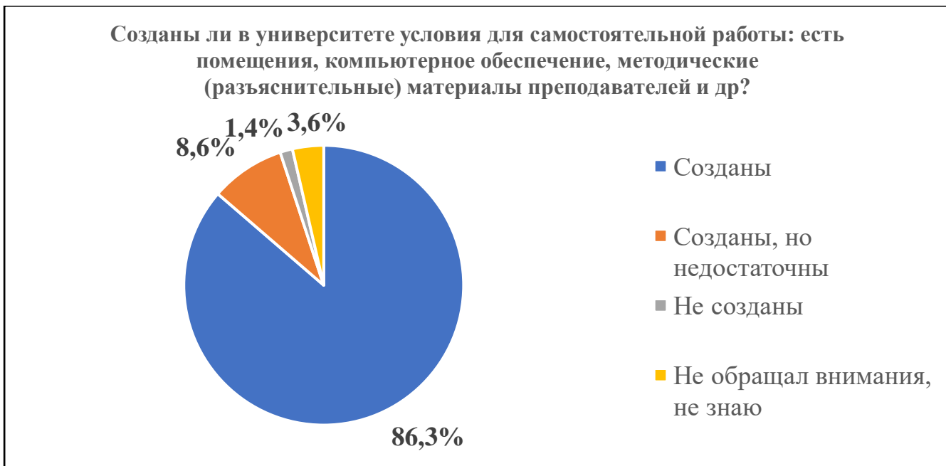
Диаграмма 8. Наличие условий для самостоятельной работы студента

Рассматривая вопрос о наличии условий для самостоятельной работы (помещения, компьютерное обеспечение, методические (разъяснительные) материалы преподавателей и др.), 86,3% опрошенных (диаграмма 8) сообщают, что в университете созданы подходящие условия, 8,6% указывают на то, что условия созданы, но недостаточны.