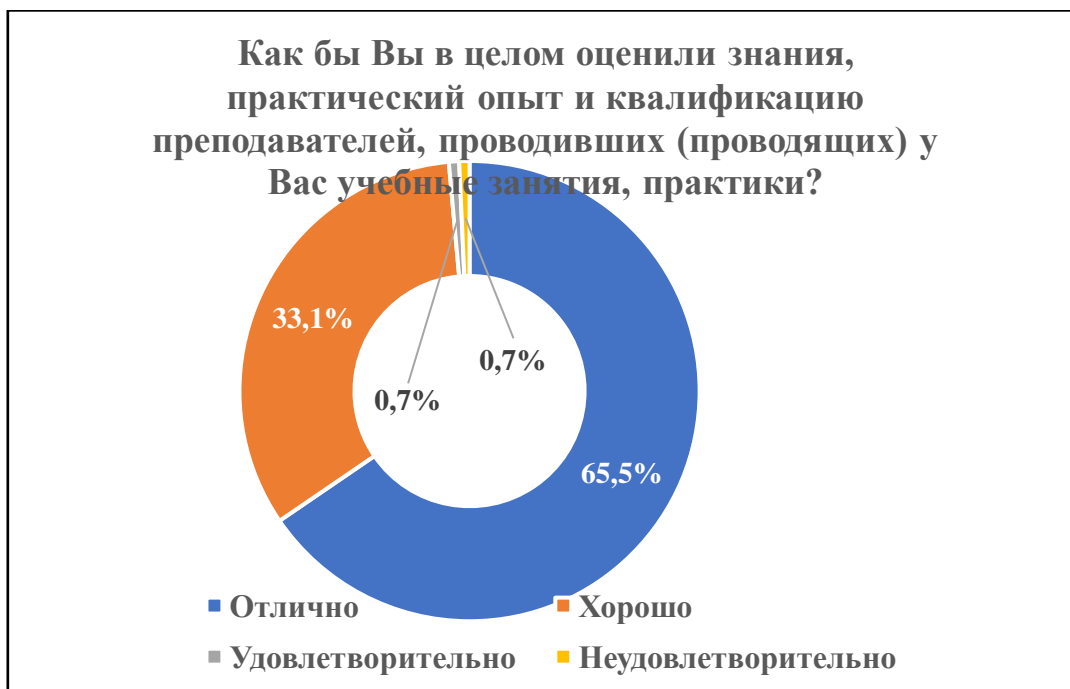
Диаграмма 10. Оценка знаний, практического опыта и квалификации преподавателей

Более 96% обучающихся высоко оценивают знания, практический опыт и квалификация преподавателей, а также объективность и непредвзятость при выставлении оценок (выбрали вариант ответа «отлично» или «хорошо»). Менее 1% респондентов выбрали вариант ответа «неудовлетворительно» для каждого из данных вопросов (диаграммы 10 и 11).