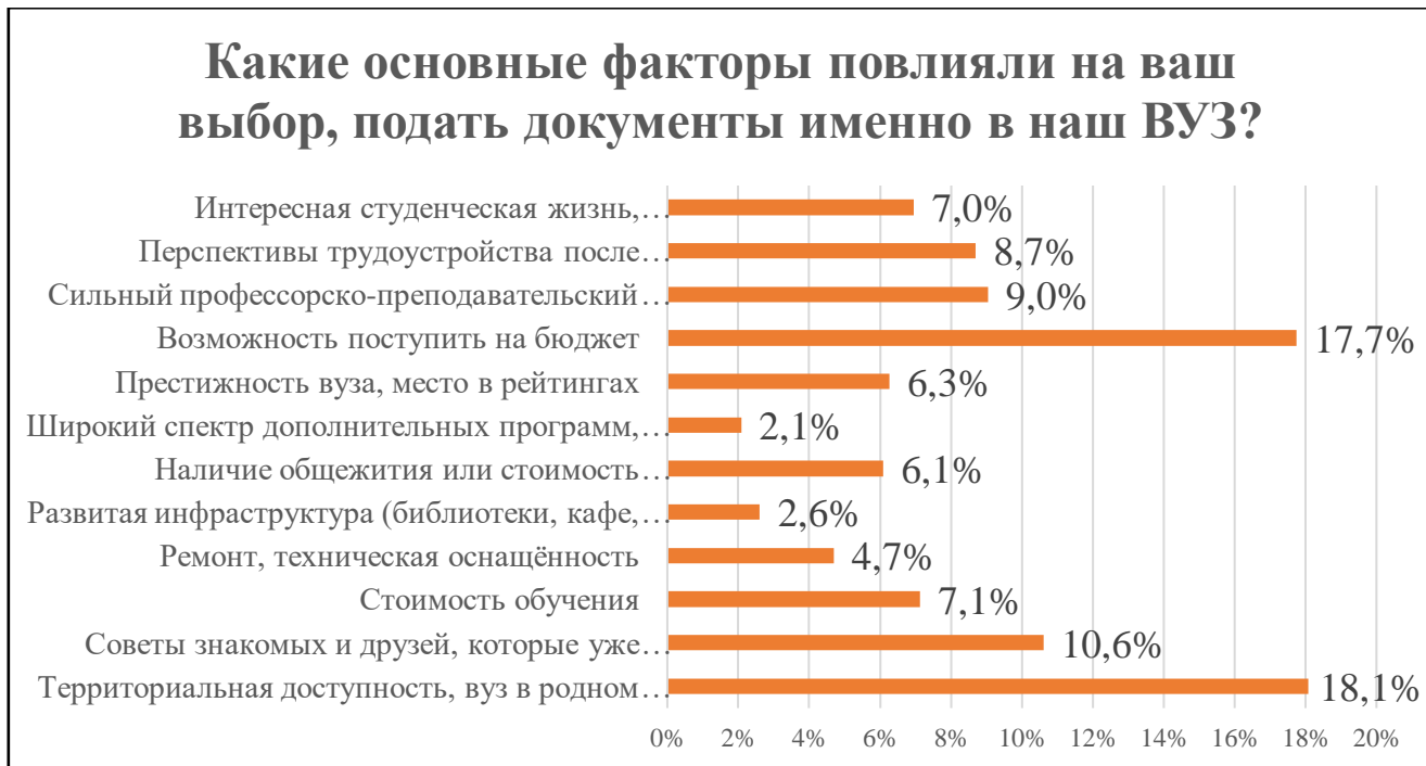
Диаграмма 2. Основные факторы, повлиявшие на выбор ВУЗа

указали возможность поступить на бюджет. На третьем месте по количеству ответов оказался фактор советов знакомых и друзей.