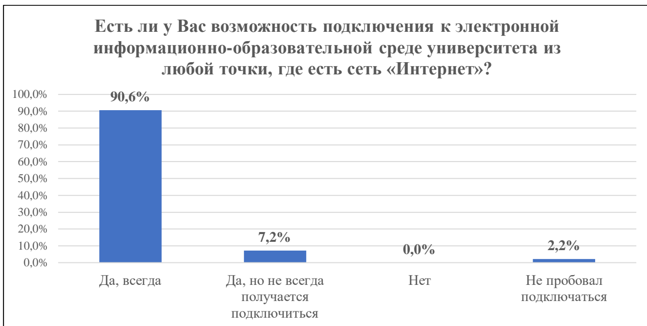
Диаграмма 6. Наличие возможности подключения к ЭИОС университета

95% студентов сообщили, что имеют доступ к учебно-методическим документам и электронным образовательным ресурсам через электронную информационно-образовательную среду университета, 7,2% – имеют, но не в полном объеме (диаграмма 7).