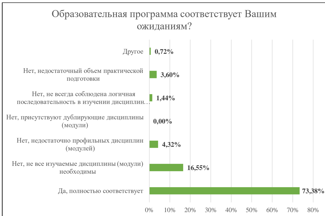
Диаграмма 4. Соответствие структуры образовательной программы ожиданиям обучающихся

Почти 90% опрошенных студентов считают, что им всегда доступна вся необходимая информация, касающаяся учебного процесса или внеучебных мероприятий. 10% обучающихся, принявших участие в опросе, считают, что не всегда.