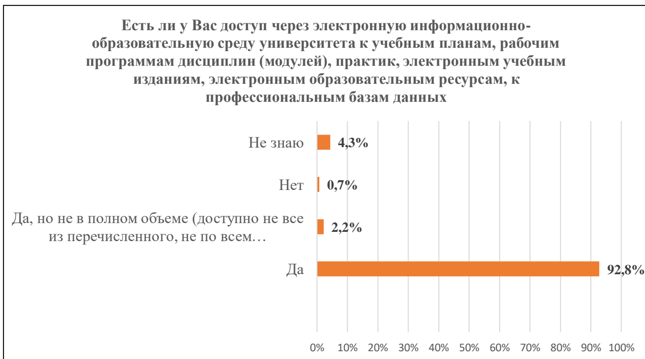
Диаграмма 7. Наличие доступа к документам и ресурсам в ЭИОС университета

В таблице 2 представлено распределение ответов респондентов, отражающих степень удовлетворенности материально-технической базой и социально-бытовой инфраструктурой университета. 100% обучающихся удовлетворены (то есть выбрали ответы «Полностью удовлетворяет» или «Скорее удовлетворяет») библиотекой и электронно-библиотечными системами, к которым университет предоставляет доступ. 97% респондентов удовлетворены